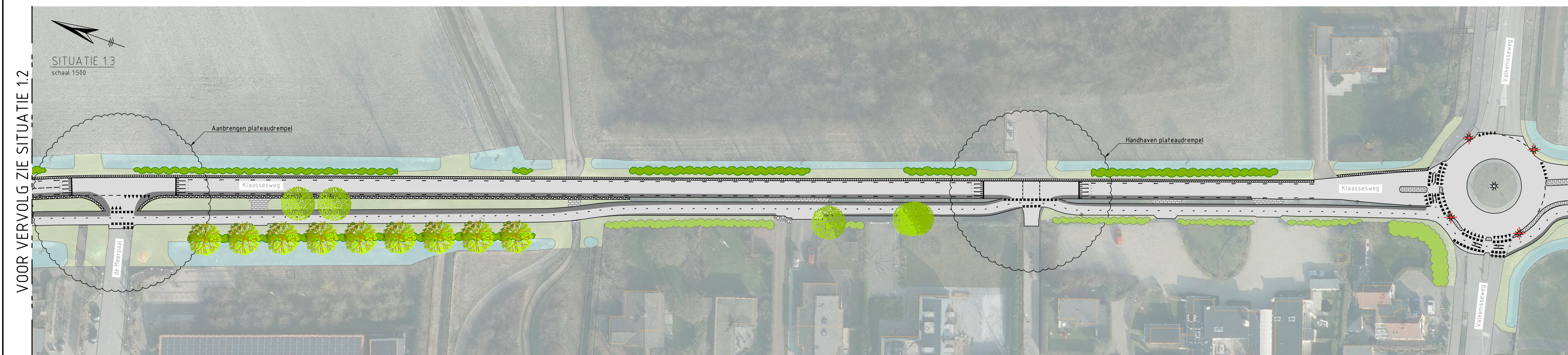
SITUATIE 1.3 schaal 1:500