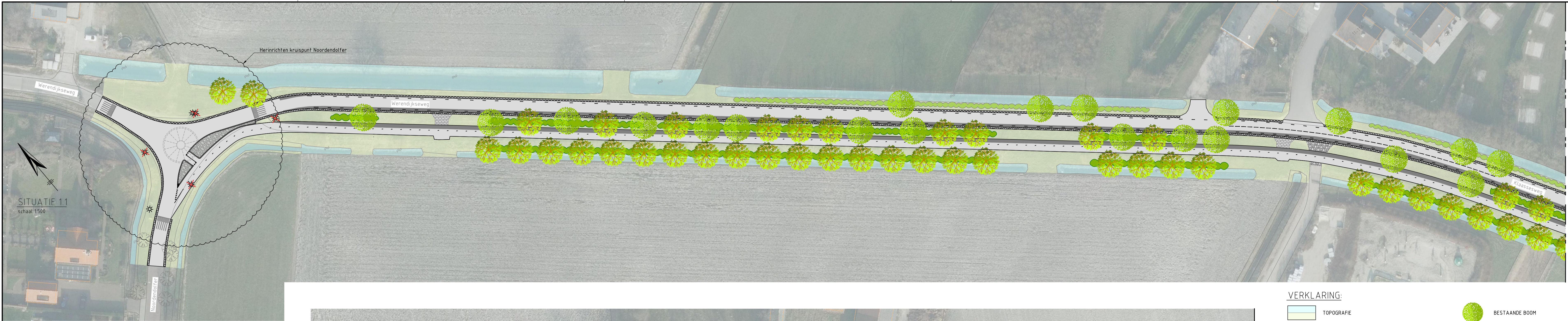
SITUATIE 1.1 schaal 1:500